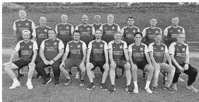
Jugendtrainer des SC Gutach/Bleibach