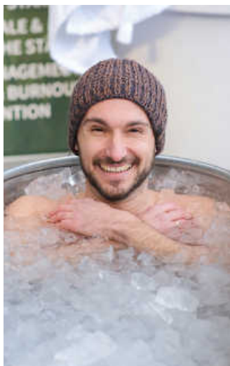
Eisbaden bei den Biohacking Days

Gute Vorsätze fassen die meisten von uns zum Jahreswechsel, doch die Natur weiß es besser: Erst mit steigenden Temperaturen erwacht sie zu neuem Leben. Die Stuttgarter Frühjahrmessen kommen wie gelegen für alle, die ihren Lifestyle auf das nächste Level bringen und ihr Wohlbefinden steigern möchten. Vom 24. bis 27. April sind Besucherinnen und Besucher eingeladen, eine einzigartige Erlebniswelt rund um Ernährung, Achtsamkeit, Nachhaltigkeit, Garten und DIY zu erleben.