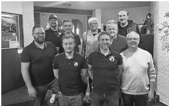
Die Vorstandschaft und die geehrten Mitglieder

Die diesjährige Jahreshauptversammlung des SC Gutach-Bleibach zeigte Konstanz und einen positiven Blick in die Zukunft. Die bestehende Vorstandschaft und Jugendleitung wurde in sämtlichen neu zu wählenden Positionen bestätigt. Ganz besonderer Dank galt auch dieses Jahr wieder den vielen ehrenamtlichen Helfern rund um den Verein und auch die sportliche Anlage. Darüber hinaus konnte man wieder einmal mit großem Stolz viele langjährige Mitglieder mit 25 Jahren, 45 Jahren und sogar 50 Jahren auszeichnen. Ein weiterer Schritt in die Zukunft konnte man durch die vertragliche Neuausrichtung mit der Gemeinde Gutach hinsichtlich der sportlichen Anlage erzielen. Im sportlichen Hinblick konnte man ebenfalls eine sehr vielversprechende Zukunftsprognose teilen. Man wird auch zukünftig weiterhin auf