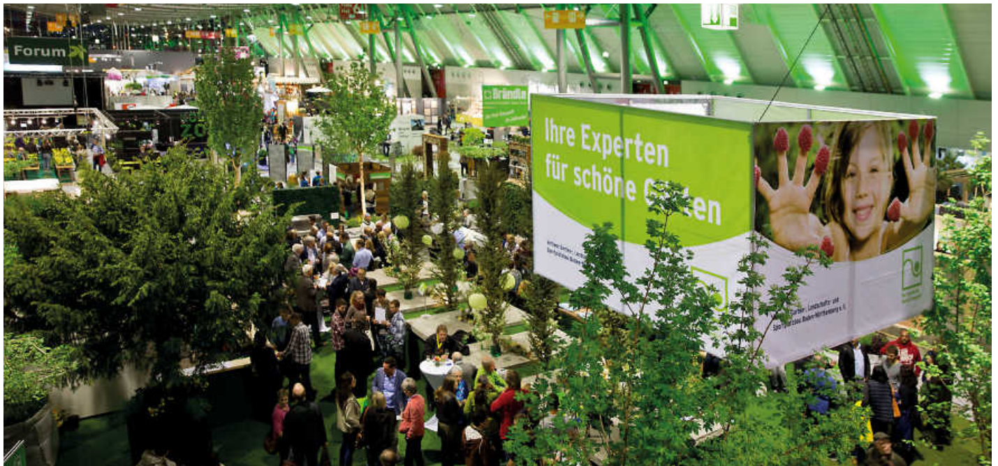
Prachtvolle Schaugärten zeigen wie das private Grün von morgen aussehen kann: klimaresistente Bepflanzung, Artenvielfalt und smarte Trends