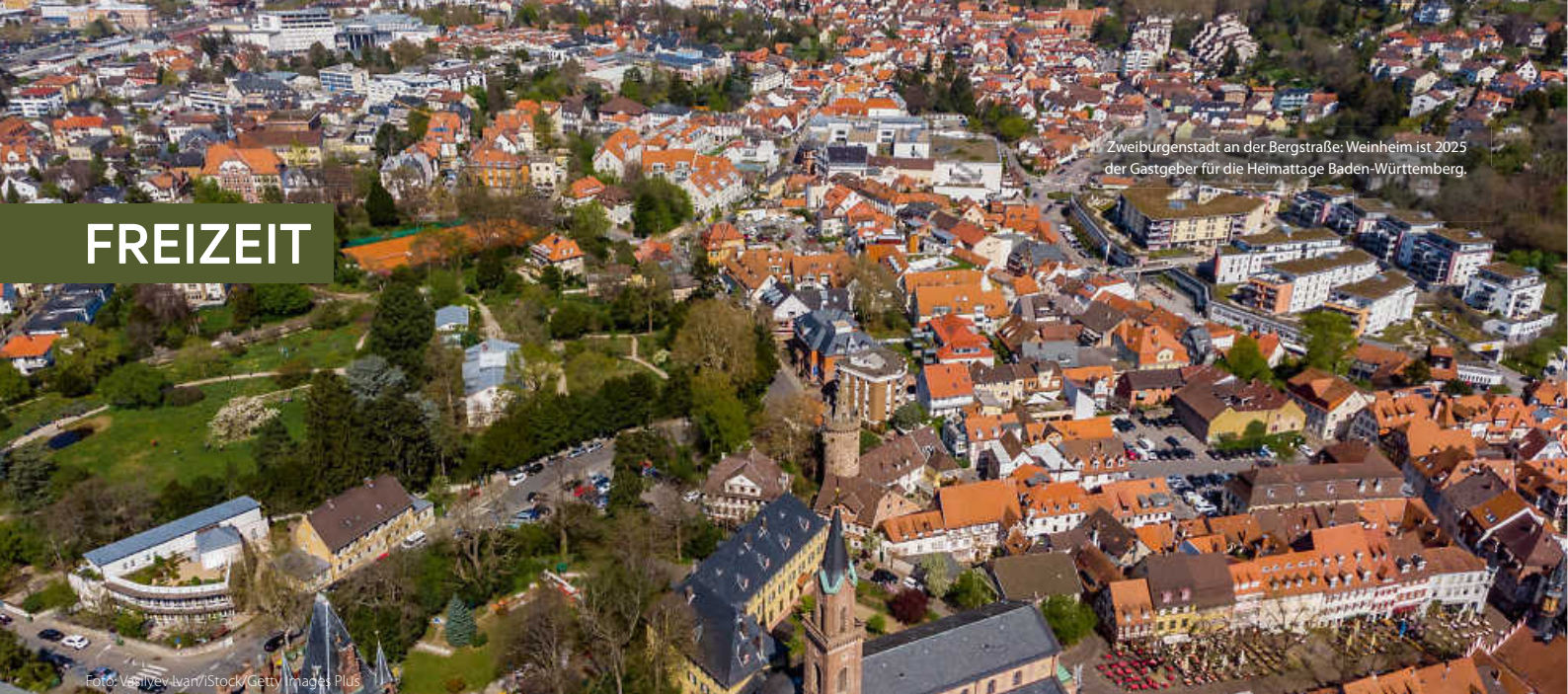
Zweibürgenstadt an der Bergstraße: Weinheim ist 2025 der Gastgeber für die Heimattage Baden-Württemberg.