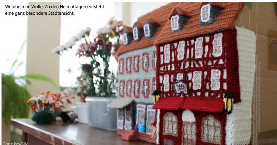
Weinheim in Wolle: Zu den Heimattagen entsteht eine ganz besondere Stadtansicht.

Der Startschuss zu den Heimattagen 2025 fällt am Sonntag, 12. Januar, im Rahmen des Neujahrsempfangs der Stadt Weinheim. Dabei wird Ministerialdirektor Rainer Moser aus dem Landesinnenministerium auch offiziell die Landes-Heimattage-Standarte an OB Manuel Just überreichen. (km/red)