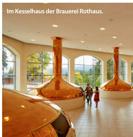
Im Kesselhaus der Brauerei Rothaus.

In den letzten Jahren haben sich zu den traditionellen Biersorten auch viele neue, kreative Variationen gesellt. Mehr als 500 Jahre nach der Einführung des Reinheitsgebots erlebt die Braukunst im Süden eine Renaissance der Experimentierfreude. Sowohl in kleinen Mikrobrauereien als auch in etablierten Familienunternehmen wird die Bandbreite an Geschmack ausgelotet. Von Amber Ale bis hin zu Porter und Stout – die Braukünstler zeigen eindrucksvoll, wie aus hochwertigen Hopfen- und Malzsorten Aromenvielfalt entstehen kann. (jr)