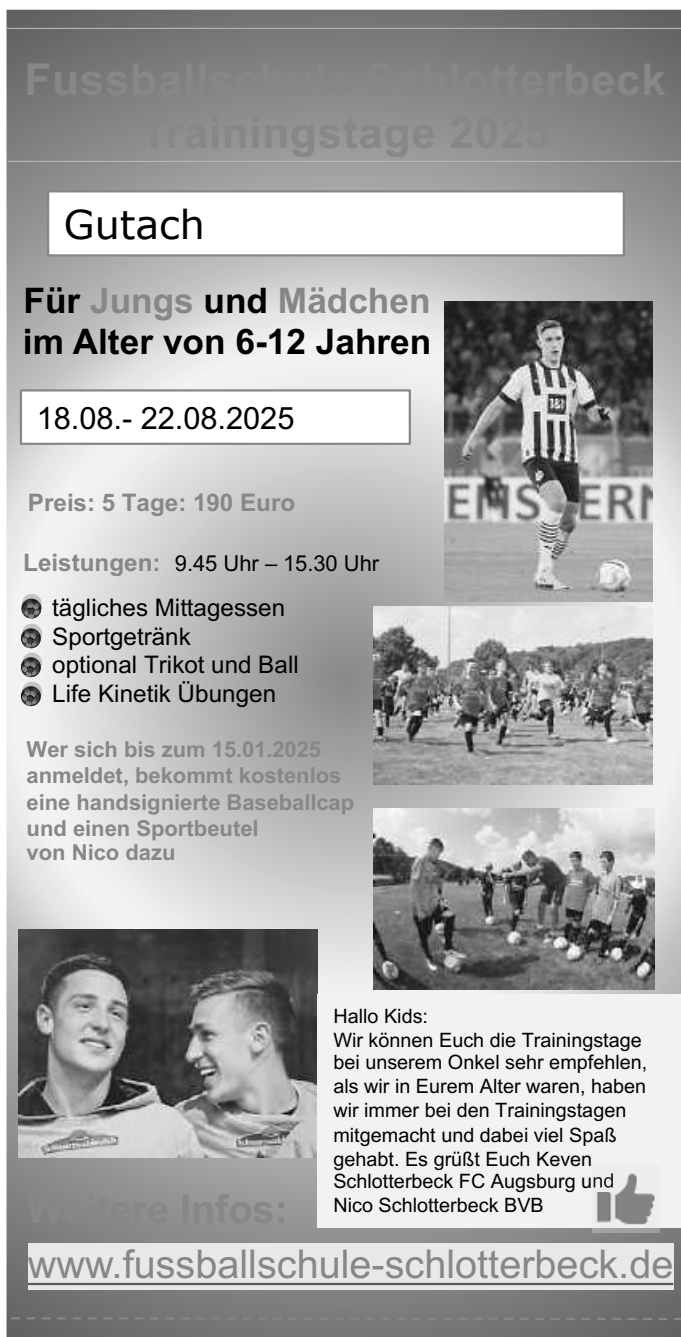
Plakat: Fußballschule Schlotterbeck