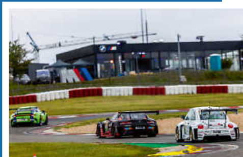
> Beetle RSR #13 in der Startphase des 24h Rennen.

Um das Projekt via PayPal direkt zu unterstützen den QR Code scannen.