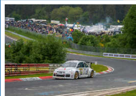
> Beetle RSR #13 in der Grünen Hölle