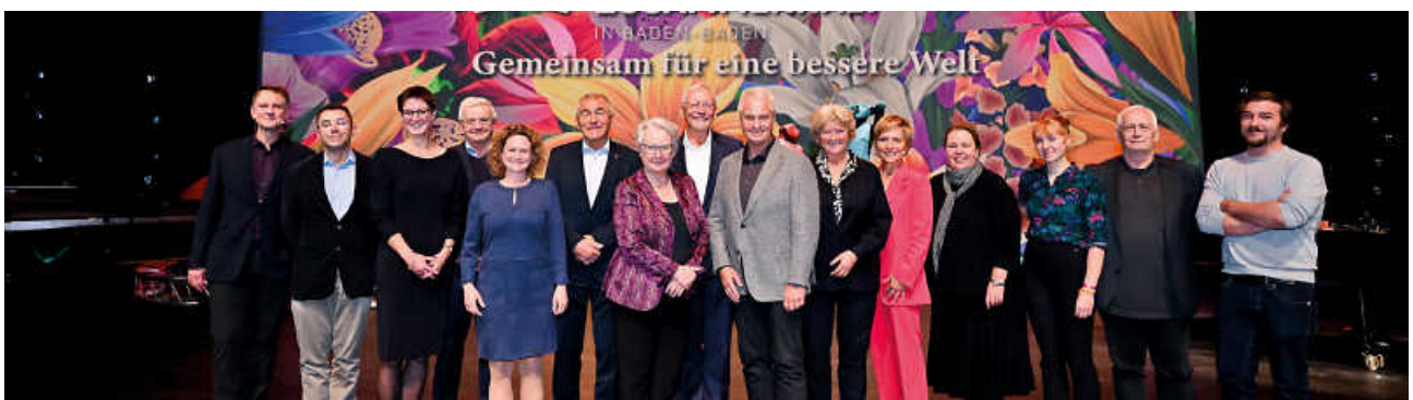
Impressionen vom Forum für Gesellschaftlichen Zusammenhalt 2022 in Baden-Baden.

Buchen Sie jetzt Ihre kostenlosen Tickets!