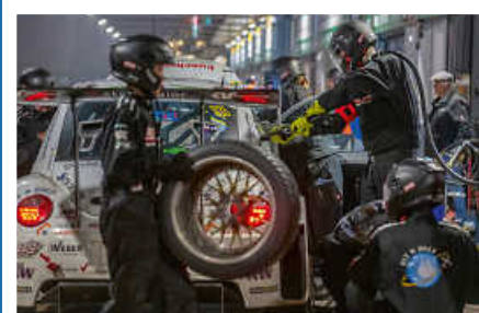
> Boxenstopp des Beetle RSR #13 in der Nacht

Jetzt über den QR-Code direkt mit dem Teamchef in Kontakt treten und das Projekt aktiv unterstützen!