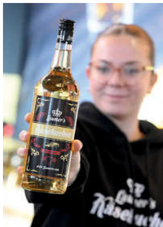
Ausgefallene Mitbringsel von der Familie & Heim – Käsekuchen aus der Flasche

Die Spielemesse ist ein Paradies für Groß und Klein. Neue Brettspiele testen, mit VR-Brille in digitale Welten abtauchen oder Roboter programmieren – hier wird gespielt, gebaut und ausprobiert.