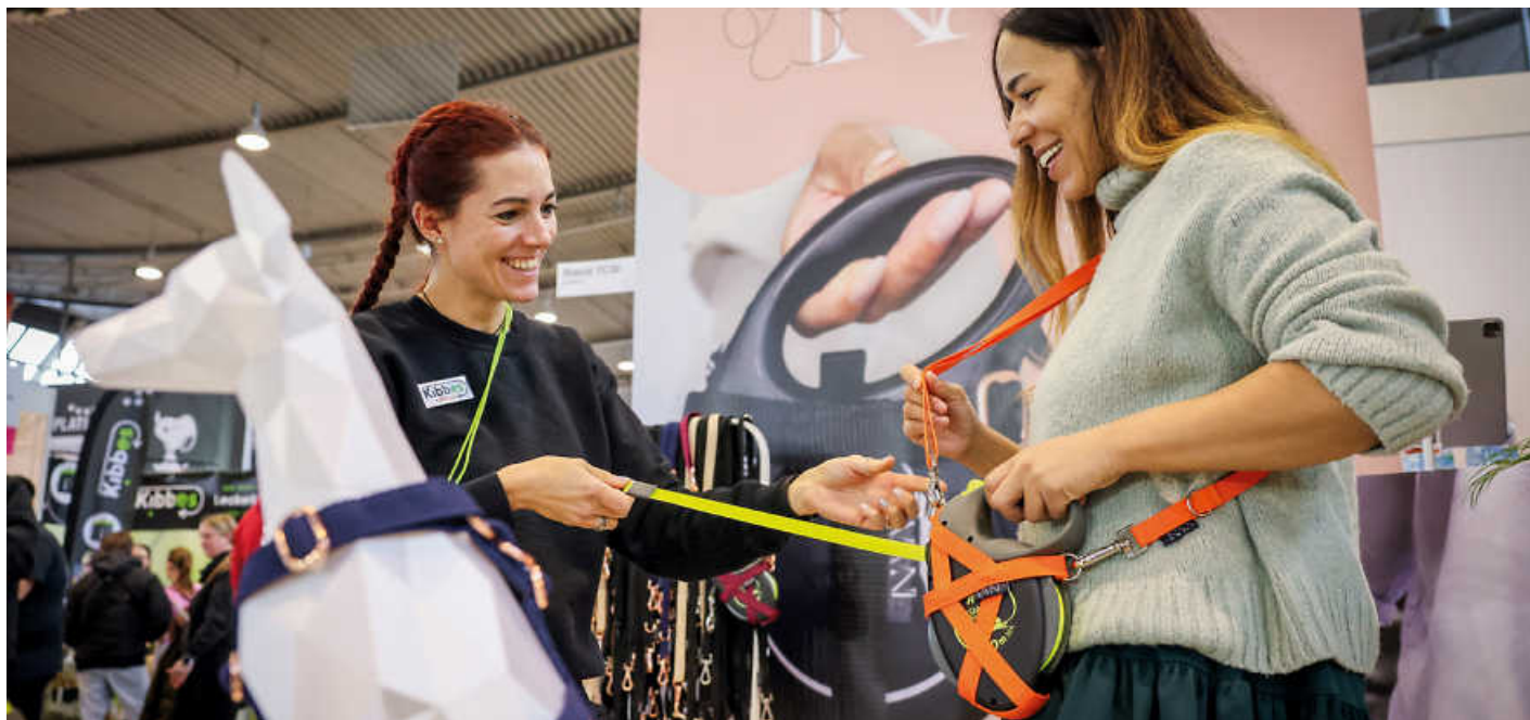
Zubehör für den vierbeinigen Liebling shoppen auf der ANIMAL