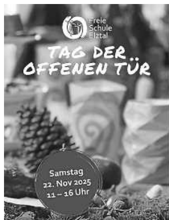
Plakat: Kindergarten und Freie Schule Elztal

Bitte kommen Sie mit dem Rad oder den öffentlichen Verkehrsmitteln (keine Parkmöglichkeit direkt an den Schulhäusern).