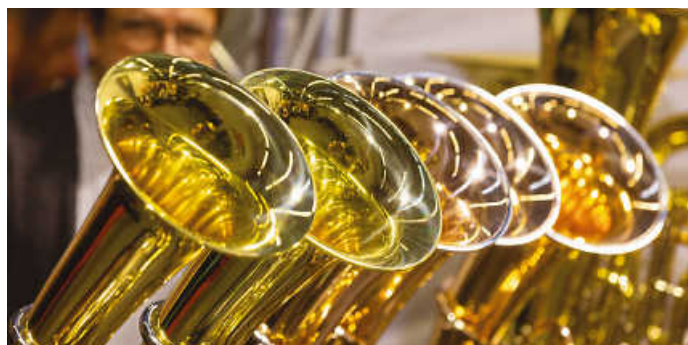
Instrumente testen auf der Blasorchestermesse BRAWO

Feinschmeckerinnen und Feinschmecker kommen bei der FOOD UND FEINES voll auf ihre Kosten. Über 100 Manufakturen präsentieren ihre Delikatessen. Live-Kochshows, Kostproben und die Sonderschau „Der gedeckte Tisch“ machen die Messe zu einem Treffpunkt für Genussmenschen.