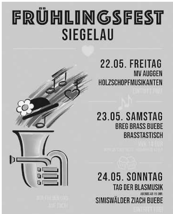
Plakat: MVTK Siegelau