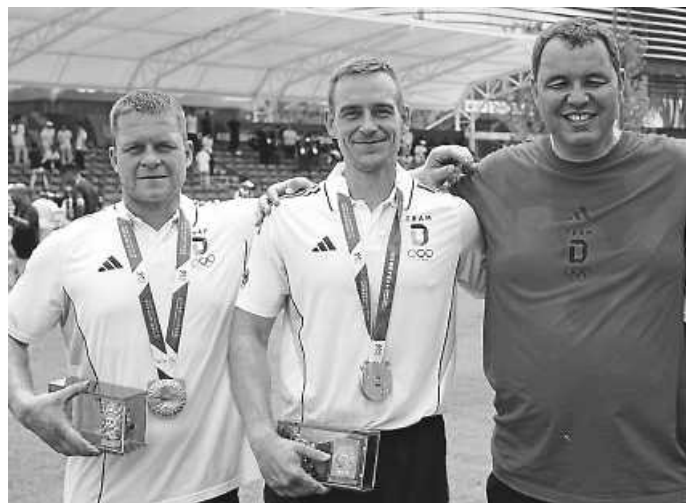
Erfolgreiche Teilnehmer der World Games

Die World Games gelten als die bedeutendste internationale Multisportveranstaltung für nicht-olympische Sportarten – und unsere Athleten haben gezeigt, dass sie dort nicht nur mithalten, sondern auch erfolgreich sein können.