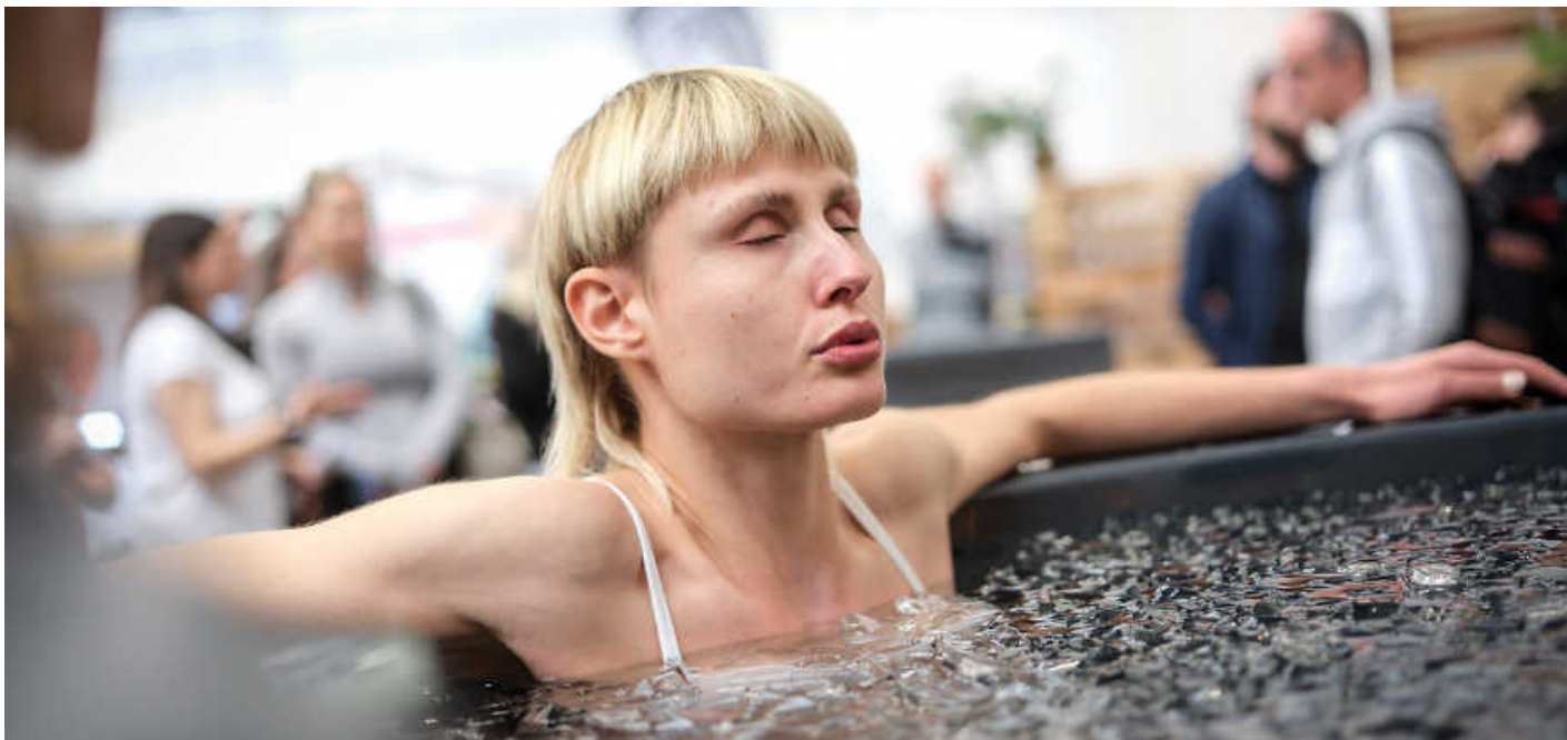
Eisbaden und Kältereize auf den Biohacking Days: Frischekick für Körper und Seele