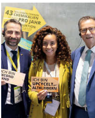
Fair macht den Unterschied

Ohne erhobenen Zeigefinger präsentiert die Fair Handeln