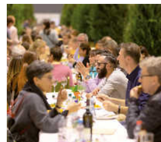
Genießen an der Langen Tafel

Gut, sauber und fair genießen und einkaufen – das geht auf der Slow Food . Ein Highlight ist die Lange Tafel. Hier finden Feinschmeckerinnen und Feinschmecker einen Platz, an dem sie durchatmen, mit Tischnachbarn ins Gespräch kommen und regionale Spezialitäten genießen können.