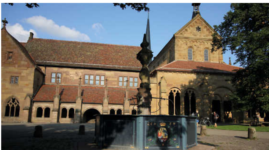
Stammt die Maultasche aus Maulbronn? Die Legende erzählt es.