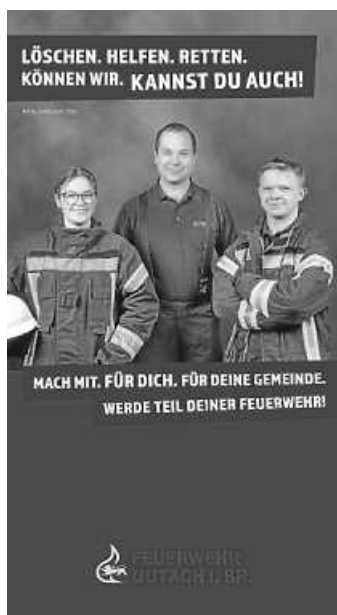
Plakat: Feuerwehr Gutach

Treffpunkt um 19:45 Uhr am Gerätehaus beim Haus der Vereine in Siegelau