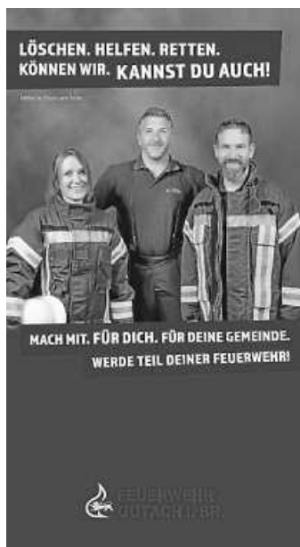
Plakat: Feuerwehr Gutach

Treffpunkt um 19:45 Uhr am Gerätehaus an der Gemeindeverbindungsstraße