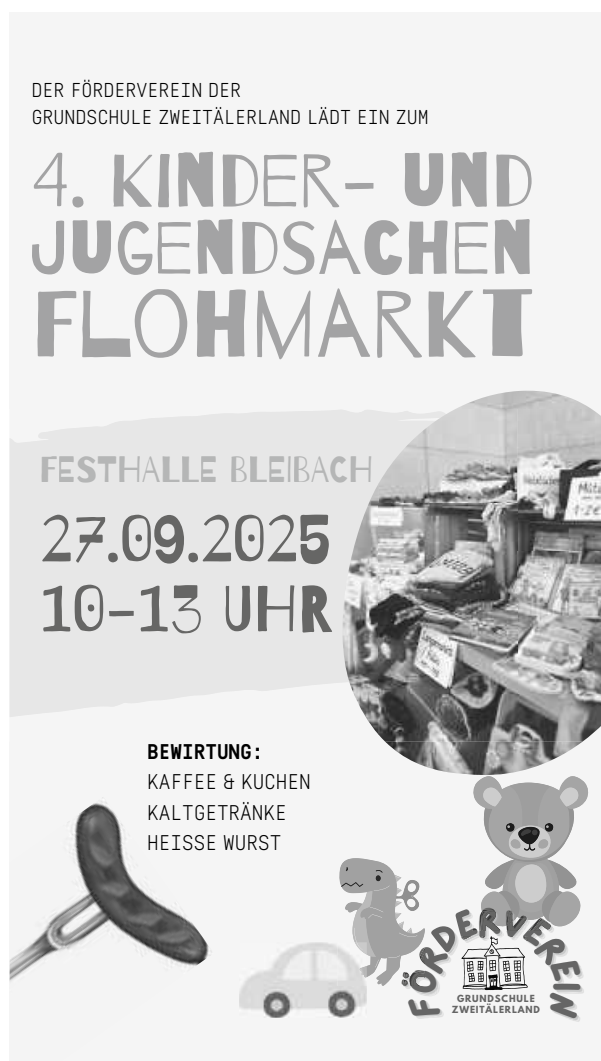
Plakat: Förderverein Grundschule Zweitälerland