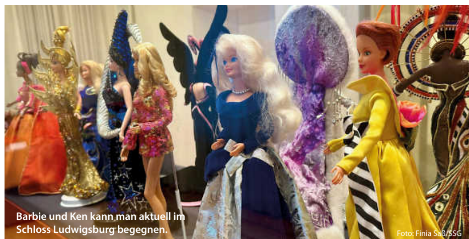
Barbie und Ken kann man aktuell im Schloss Ludwigsburg begegnen.

Jedes Museum bietet nicht nur Spaß für Kids, sondern sorgt auch bei den Älteren für eine kleine Atempause mit dem Gefühl: Hier wird unser Alltag erleichtert. Und das Beste? Viele dieser Einrichtungen haben familienfreundliche Eintrittspreise. Perfekt für einen vollen Tag – ohne, dass am Abend der Geldbeutel stöhnt. Fertig sind 10 Abenteuer, die Lust machen, neue Welten zu entdecken. Also: Wer packt den Rucksack? (ral/jr/red)