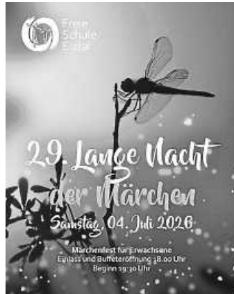
Plakat: Kindergarten und Freie Schule Elztal e. V.

Weitere Informationen unter www.freieschuleelztal.de