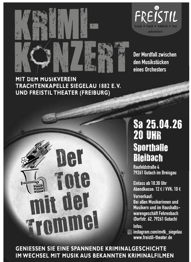
Plakat: MVTK Siegelau