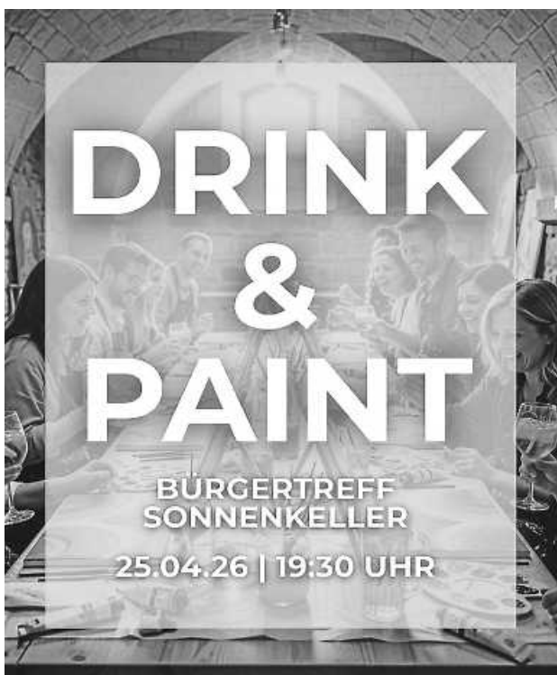
Plakat: Bürgertreff Sonnenkeller e. V.