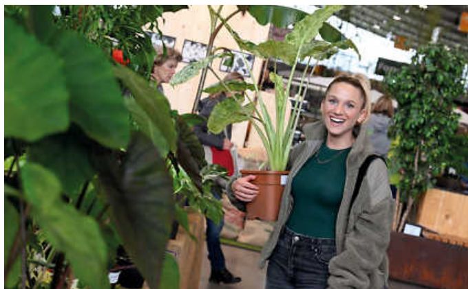
Alles für den grünen Daumen