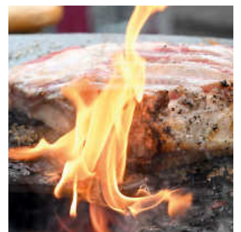
Grillen um die Meisterschaft

Mit spannenden Grillvorführungen, Verkostungen und Profi-Tipps rund ums Grillen sind die BBQ Days für Grillfreunde und Genießerinnen ein Muss! Wer sich von den neuesten Grills und Outdoor-Küchen ebenso inspirieren lassen möchte, wie von den professionellen Skills der besten Grillmeisterinnen und -meister ist bei den BBQ Days genau richtig. So schmeckt das Steak von morgen!