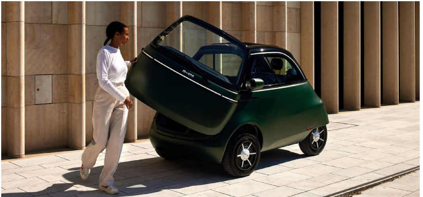
Der neue Microlino: Urbane E-Flitzer und viele weitere Fahrzeuge vor Ort testen – auf der i-Mobility!