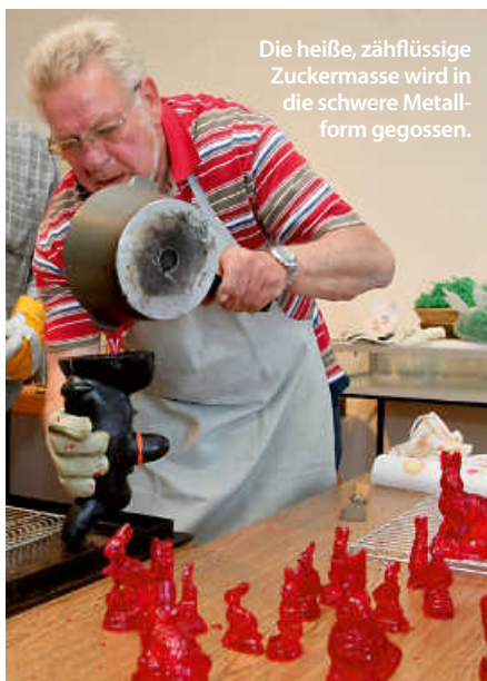
Die heiße, zähflüssige Zuckermasse wird in die schwere Metallform gegossen.

Zum Abkühlen wird die Form auf einen Metallrost gestellt. Zurück bleibt eine hohle, dünnwandige Figur. Nach dem Aushärten muss der überschüssige Zucker abgeklopft werden.