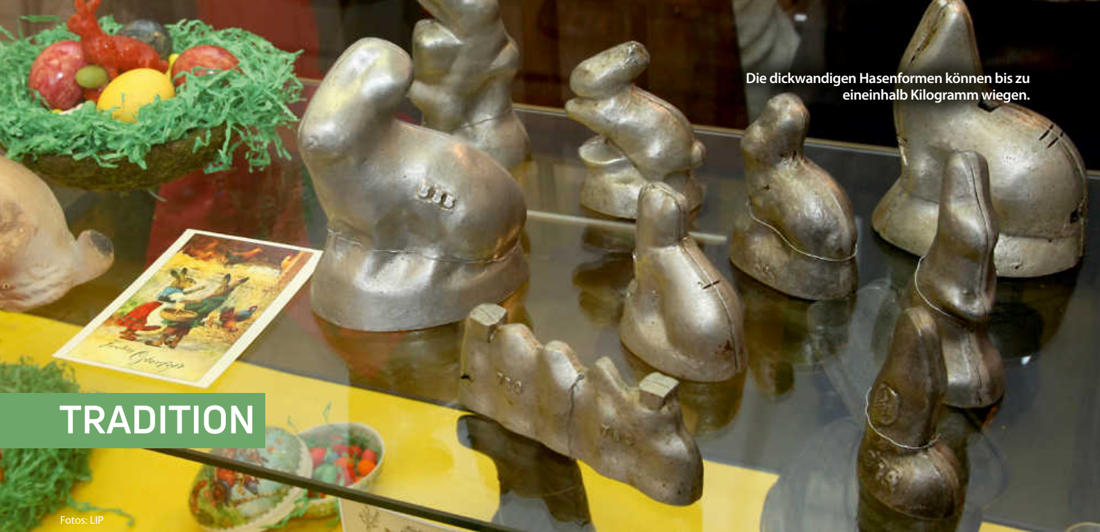
Die dickwandigen Hasenformen können bis zu eineinhalb Kilogramm wiegen.