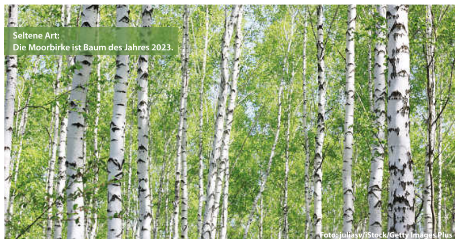
Seltene Art: Die Moorbirke ist Baum des Jahres 2023.