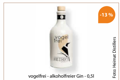
vogelfrei - alkoholfreier Gin - 0,5l

Der Name „Heimat Vogelfrei“ ist neben dem Heimatbezug vor allem ein historisch angelehntes Wortspiel. „Das Wort vogelfrei war früher bezogen auf Menschen, die frei vom Gesetz waren und somit frei von Konventionen oder Normen lebten. Genauso verhält es sich mit unserem Vogelfrei. Als alkoholfreie Spirituose entspricht er nicht unseren alt dahergebrachten Vorstellungen, sondern definiert diese neu, vogelfrei eben. Aber es ist auch ein Wortspiel, vogel-FREI von Alkohol“, betont Richter. (haf)