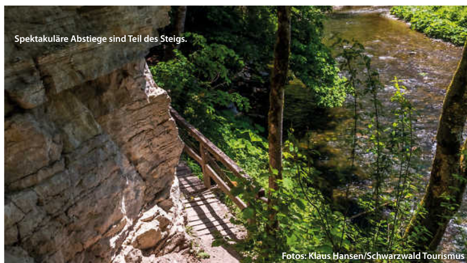
Spektakuläre Abstiege sind Teil des Steigs.

Am Ende macht die Mischung den Reiz des Steigs aus: massive Felswände, enge Pfade, Ursprünglichkeit der Natur, rauschende Flüsse und Wasserfälle, aber ebenso Bergwiesen und imposante Blicke, sowohl in die Ferne (Alpen, Feldberg, Schluchsee) aber auch in die Tiefe der durchwanderten Schluchten. (haf)