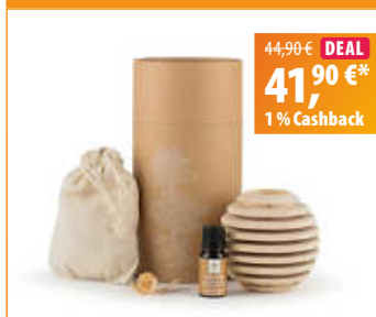
LivingDesigns Duftholz Zirbe „globe“

Vereinbarere gerne einen Termin zur individuellen Schlafberatung und freue dich auf einen erholsameren und gesünderen Schlaf.