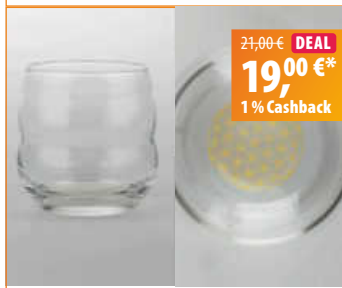
natures Set: 2 x Glas „Mythos“, gold