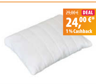
Relax Zirbenkissen, 30 x 40 cm