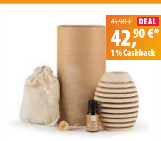
LivingDesigns Duftholz Zirbe „pine“