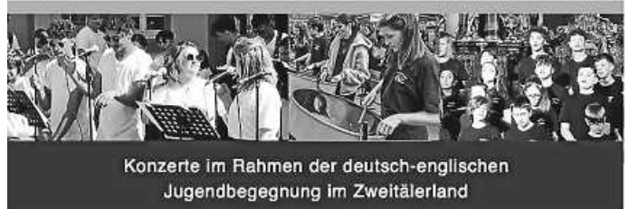
Konzerte im Rahmen der deutsch-englischen Jugendbegegnung im Zweitälerland