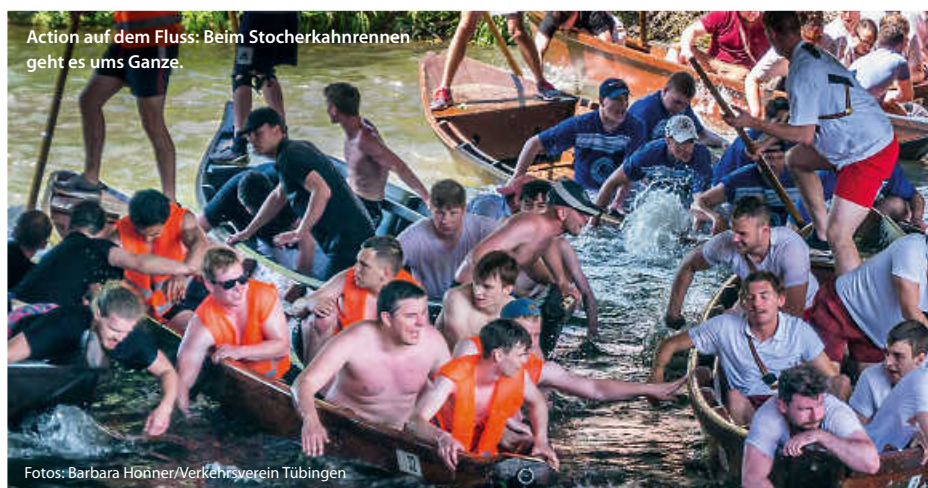
Action auf dem Fluss: Beim Stocherkahnrennen geht es ums Ganze.

Ein Wanderpokal und ein Fass Bier gibt es für die Sieger, die einfallsreichsten Verkleidungen werden mit einem Spanferkel belohnt. Die Verlierer und Havaristen trifft es hart: sie müssen unter dem frenetischen Beifall der Zuschauer pro Person einen halben Liter Lebertran trinken – einer der Höhepunkte des Festes. Und während die ersten das Freibier für den Festabend besorgen, müssen sich die Letzten schon einmal Gedanken über die Ausrichtung des nächsten Stocherkahnrennens machen. So will es die Regel. (tvv/red)