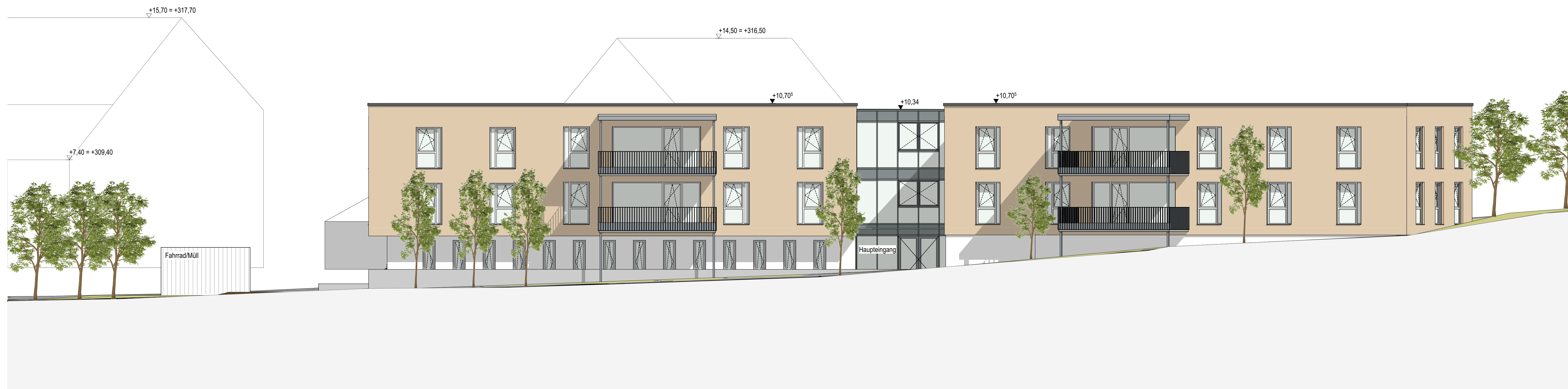
Ansicht Süd-Alte Ziegelei